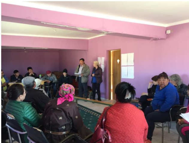
Олон Талт Мэргэжлийн Шинжээчдийн Багийн шинжээчид баримтыг хамтран олж тогтоох үйл явцын хүрээнд малчидтай уулзаж байна, 2016 оны 5-р сар