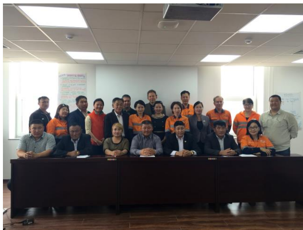
Гурван Талт Зөвлөлийг байгуулах Санамж Бичигт гарын үсэг зурах ёслолд ЭЗХНЗОГ-ын дэд ерөнхийлөгч оролцов, 2015 оны 6-р сар