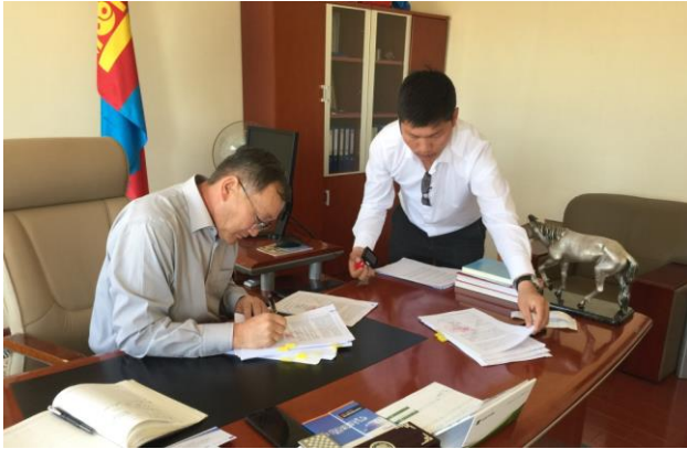
Ханбогд сумын засаг дарга гэрээнд гарын үсэг зурав, 2017 оны 5-р сар

Талууд гомдлыг барагдуулах хоёр гэрээг 2017 оны 5-р сард байгуулсан учраас эвлэрүүлэн зуучилж чиглүүлэх ажлыг дуусгавар болгон ЭЗХНЗОГ хоёр гомдлыг тохиролцооны хэрэгжилтэнд мониторинг хийж эхлэсэн юм. Талууд гэрээнүүдэд гарын үсэг зурсан өдрөөс хойш тэдгээрийн заалтын хэрэгжилтэнд ЭЗХНЗОГ-аар 12 сарын турш мониторинг хийлгэхээр тохиров.