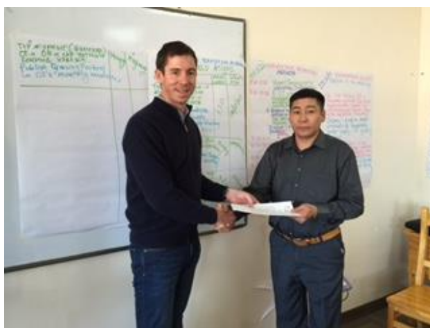
Оюу Толгойн Үйл Ажиллагаа Хариуцсан Захирал малчдын төлөөлөлд уучлал хүссэн захидал гардуулав, 2015 оны 3-р сар

Талууд хийхээр тохирсон ажил тус бүрээр нарийн төлөвлөгөө гарган, хэрэгжүүлэх хугацааг товлох ба тохирсон ажлуудын хэрэгжилтийг хангахад шаардлагатай хөрөнгө, санхүүжилтыг Компани хариуцахаар тохиролцсон болно.