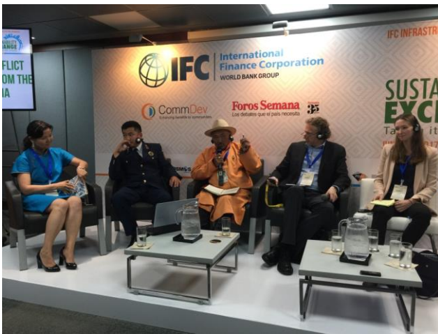
ГТЗ, Аккаунтабилити Консул, ОУСК-ийн төлөөлөгчид Колумба улсын Картахена хотод зохион байгуулсан ОУСК-ийн Тогтвортой Байдлын Туршлага бага хуралд оролцов – ЭЗХНЗОГ илтгэлийг хөтлөв, 2017 оны 6-р сар

гомдлын үндсэн талууд шийдлийг олохын тулд Ханбогд сумын засаг захиргаан оролцуулах шаардлагатай болохыг ойлгож эвлэрүүлэн зуучлах үйл явцад оролцохыг хүсч орон нутгийн засаг захиргаанд хандахаар тохиролцсон. Орон нутгийн засаг захиргаа ч зөвшөөрч талууд харилцан тохиролцсон дэг, дүрмийн хүрээнд ажиллах Гурван Талт Зөвлөлийг байгуулсан билээ. Энэ нь орон нутгийн засаг захиргааны туршлага, нөөц бололцоог ашиглах, сумын хөгжлийн ерөнхий төлөвлөлттэй ажлаа уялдуулах, холбогдох зөвшөөрөл авах, үйл явц ба үр дүнг улам хариуцлагатай байх нөхцлийг бүрдүүлэхэд тусласан юм.