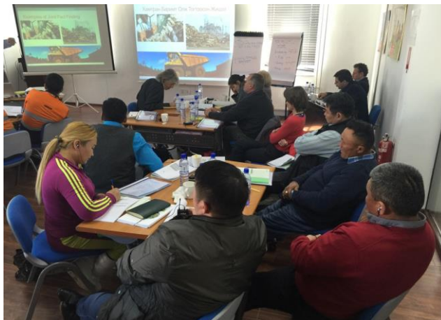
Компани, малчид, орон нутгийн засаг захиргаа ба хөндлөнгийн шинжээчид баримтыг хамтран олж тогтоох (БХОТ) үйл явцад оролцож байна, 2016 оны 2-р сар,

Үнэлгээний ажлыг жил хагасын хугацаанд гүйцэтгэсний дараа 2017 оны 1 дүгээр сард шинжээчид эцсийн тайлан, зөвлөмжүүдээ танилцуулсан. Талууд зөвлөмжүүдийг хүлээн авч тэдгээрийг хэрэгжүүлэх төлөвлөгөөг хамтран боловсруулахаар тохирсон болно.