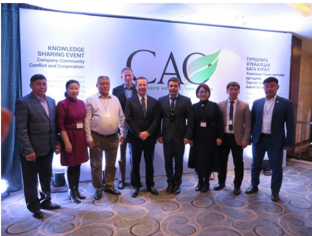
Оюу Толгой компаний гүйцэтгэх захирал, ГТЗ-ийн гишүүд, ЭЗХНЗОГ-ын баг Улаанбаатар хотод зохион байгуулсан Мэдлэг Туршлагаа Хуваалцах Бага Хурлын үеэр, 2019 оны 3-р сар