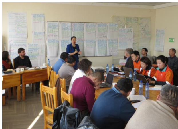
ЭЗХНЗОГ-ын эвлэрүүлэн зуучлагч талуудын хамтарсан хурлын үеэр, 2014 оны 12-р сар