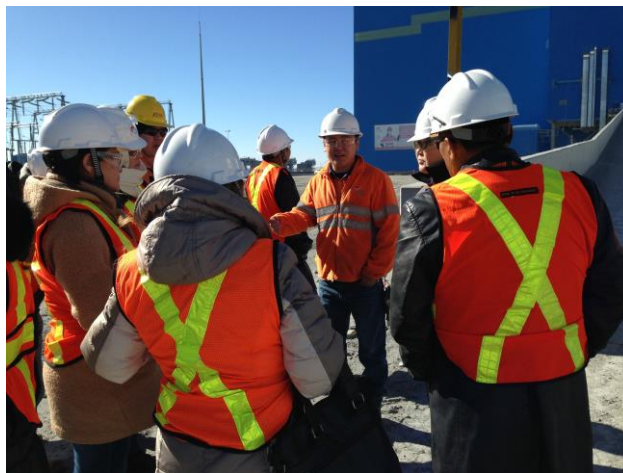
Малчид, ОТ Хяналт ТББ компанийн төлөөлөгчдийн хамт уурхайн талбайд, 2014 оны 11-р сард

ажиллуулах цар хүрээг хамтран тодорхойлж, шинжээчдийг хамтран сонгон шалгаруулж, үйл явцын загварыг хамтран боловсруулж, баримтыг олж тогтоох үйл явцад хамтран оролцдог. Баримтыг Хамтран Олж Тогтоох үйл явц, ЭЗХНЗОГ, Практик үйл ажиллагааны эргэцүүлэл 3-ыг (2019) http://www.cao-dr-practice.org/reports/CAO_3_JointFactFinding.pdf хаягаас үзнэ үү. (2020 оны 4-р сарын 28-нд сүүлд нэвтэрч үзсэн)