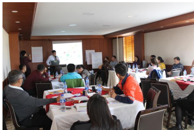
Гурван Талт Зөвлөл ба ЭЗХНЗОГ нь ОУСК-ийн Өмнөговийн Ус ба Уул Уурхайн Салбарын дугуй ширээний ярилцлагын үеэр бусад уул уурхайн компаниудтай туршлагаа хуваалцаж байгаа нь, 2016 оны 9-р сар